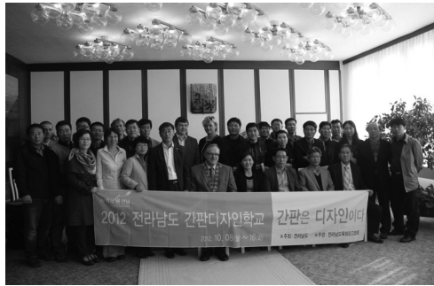
〈2012. 간판디자인학교 운영〉

2012년도 제4회 간판디자인학교는 체코, 폴란드, 슬로바키아, 헝가리, 오스트리아 등 동유럽 5개국의 우수광고물 벤치마킹과 간판에 대한 다양한 솔루션 습득을 통한 간판에 대한 새로운 마인드를 정립하고