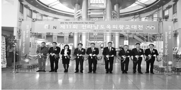
〈2012 제11회 전라남도 옥외광고대전 개최〉