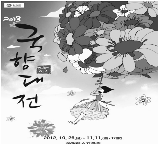
2012. 10. 26.(금) ~ 11.11.(일) / 17일간 함평엑스포공원 대상-국화향기에 취하다 (함평 국향대전)