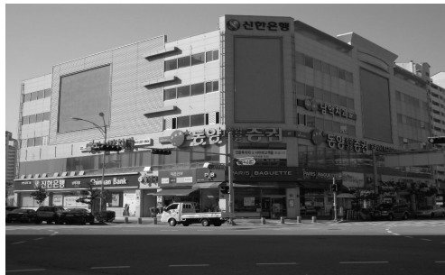
〈2012 간판개선사업 및 도시경관 정비현황〉