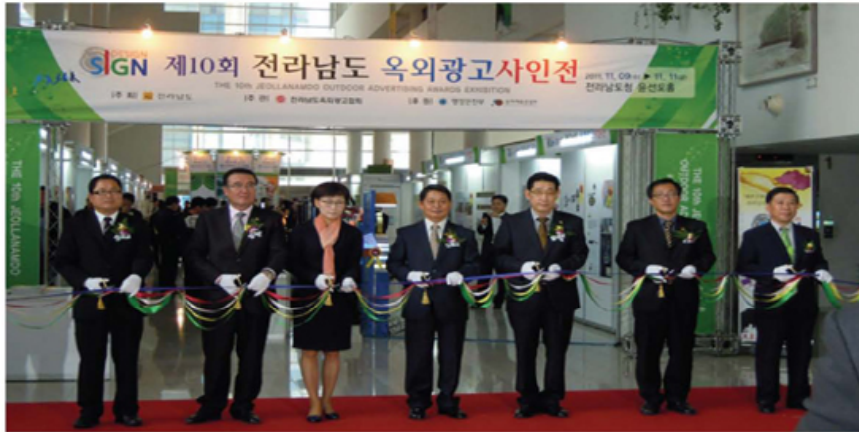
〈2011 제10회 전라남도 옥외광고대전 개최〉

쓰기대회 3점) 등 전라남도청 운선도 홀에서 개막 전시회 및 순회전을 실시하였다. 전시회에는 옥외광고대전 선정 우수광고물과 국내 광고물 시범거리 및 간판개선 우수사례 옥외광고 변천사 및 테마기획전 등을 전시해 많은 볼거리를 전시하였다.