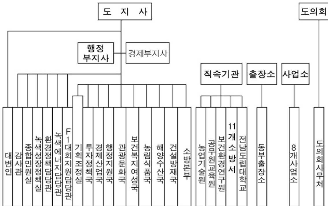
〈표 1-3〉 전라남도 기구표

1실은 기획조정실이고, 8국은 투자정책국, 경제산업국, 행정지원국, 관광문화국, 보건복지여성국, 농림식품국, 해양수산업국, 건설방재국이고 1본부는 소방본부가 있으며, 도지사 직속으로 대변인, 행정부지사 직속으로 감사관, 종합민원실, 녹색성장정책실, 환경정책담당관, 녹색에너지담당관, F1대회지원담당관이 각각 있다.