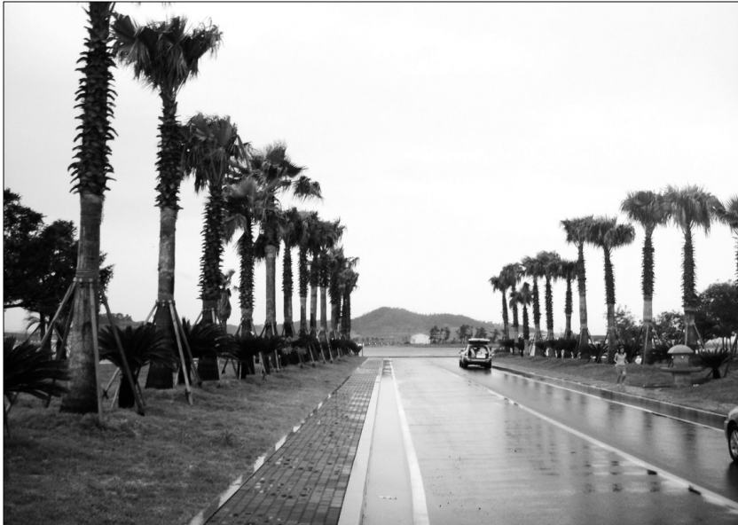
<신안 방축 어촌관광단지 조성>

어촌지역의 관광기반시설 확충 및 정주환경시설 개선을 통한 어업인의 삶의 질 향상과 더불어 도시·어촌간 교류확대로 어업의 소득증대를 도모하고자 2006년부터 어촌·어항관광조성사업을 추진하고 있으며, 사업지구는 강진 마량항과 신안 방축마을이다.