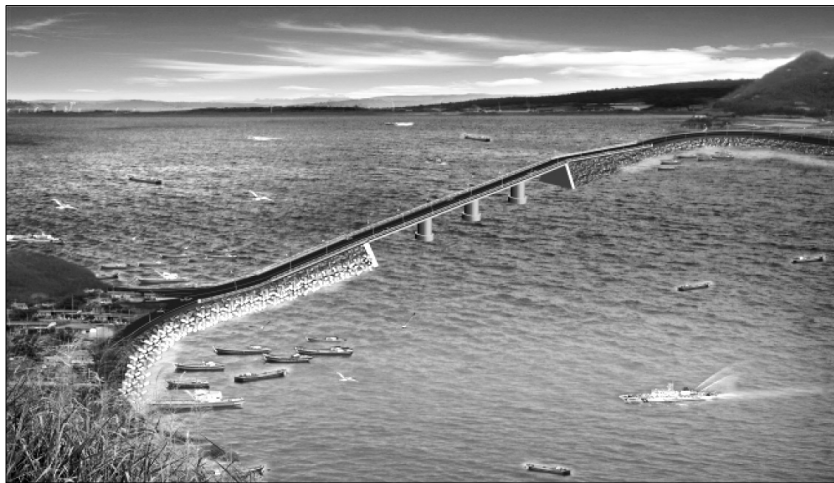
<장흥 사촌~장재도간 통수시설 조감도>

사업추진 배경은 지난 1960년 축조된 안양면 사촌~장재도간 연륙제방 독(360m)은 약 50여년간 육지와 섬을 연결하는 통행수단으로 이용되어 왔으나 그동안 조류의 흐름이 차단되어 오염된 퇴적물로 연안 생태계에 악영향을 미치는 원인으로 작용하였다. 이로 인해 갯벌의 생태계 변화로 패류 양식장 범위는 축소되고 굴, 고막, 바지락 생산량 감소로 소득감소를 보이는 등 생태환경 변화에 따른 피해는 지속되었고, 바닷가와 갯지렁이 개체수가 현저히 감소하였으며 섬 앞쪽 해변의 모래가 침식되어 가는 현상이 나타났다. 또한 제방은 협소하여 주민통행 불편을 주어 이를 해소하기 위해 지난 2006년부터 제1차 연안정비사업으로 총사업비 7,492백만원을 투입 년차별 사업 중 2007년 10월 50여년간 막혀있던 제방을 없애고 바닷물이 드나들 수 있는 통수 시설인 연륙 교량 120m을 완료함으로써 갯벌이 되살아나는 등 생태계복원 효과가 가시화 되었다.