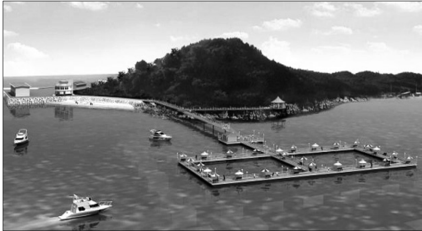
<장흥 해양낚시공원 / '09. 8월 개장>

주요사업내용은 목포 요트산업기반구축, 여수 해양친수공간조성, 진도 울돌목 해양에너지공원조성, 보성 해양복합레저공간조성, 함평 마리나 조성, 장흥 해양낚시공원조성, 해남 땅끝 해양자연사 박물관 건립, 완도 해양종합공원조성·소안어촌관광마을조성·해양테마펜션단지조성 등이다.